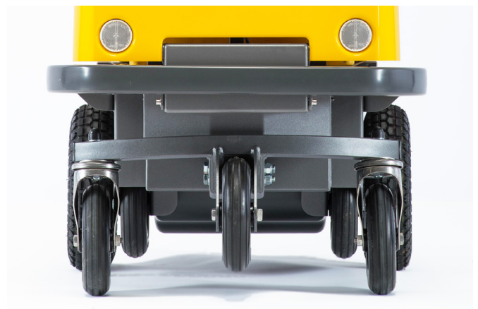
Treppensteigen möglich durch extra Rad