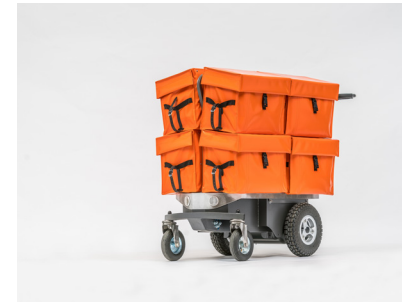
eTrolley BG eTrolley für 8 Posttaschen