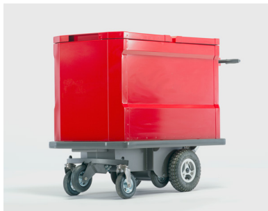
eTrolley Box eTrolley mit grossem Behälter