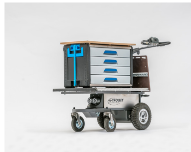
eTrolley Tool eTrolley mit individuellem Aufbau