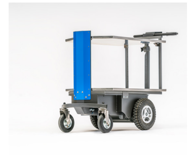
eTrolley Table eTrolley mit Tischgestell