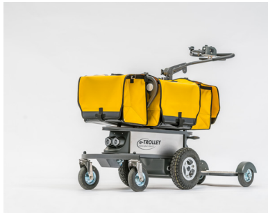
eTrolley 4+1 Trolley für 4 Posttaschen und optionalem Trittbrett