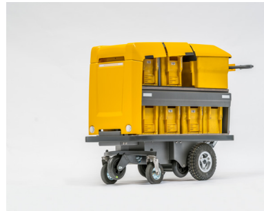
eTrolley 7+1 eTrolley für 8 Postbehälter