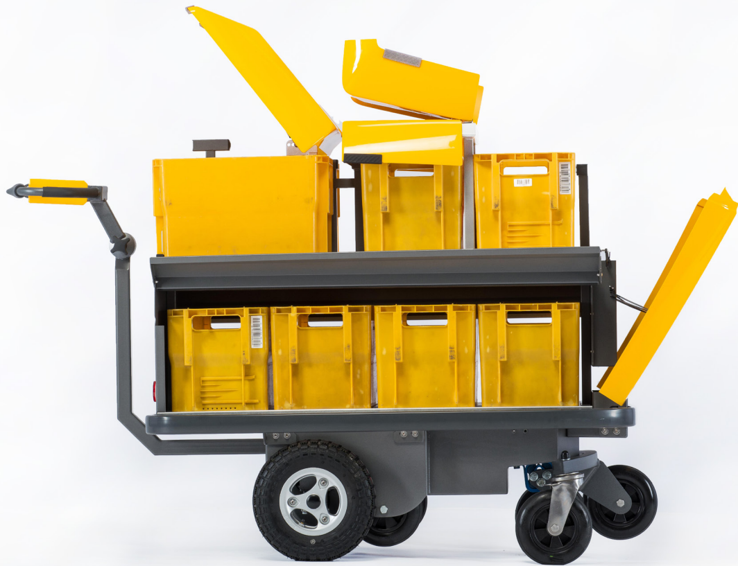
Einfacher Zugang zur Ladung